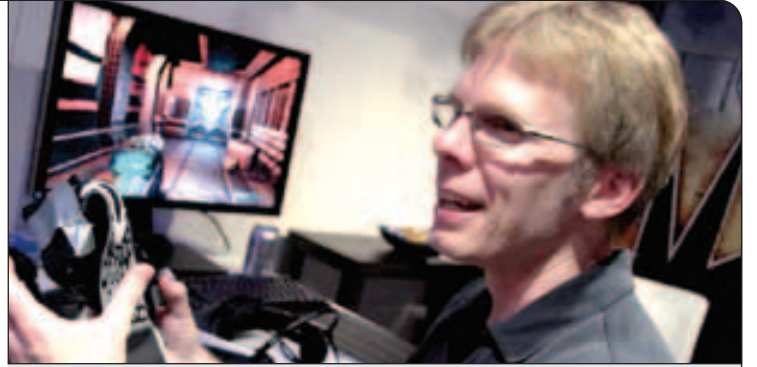
روش‌های نوین جان کارمک در برنامه‌نویسی باعث ایجاد تحولی در کیفیت گرافیکی بازی‌های رایانه‌ای شده است

ما به طور همزمان با سه تیم به صورت جداگانه روی پروژه‌های Quake و Wolfenstein و DOOM کار می‌کردیم. به نظر من ZeniMax بیشتر یک شرکت مالی است و ما هم برای پروژه‌هایمان به یک پشتوانه ثابت مالی نیاز داشتیم و این معامله باعث شد که اگر ما از نظر مالی با مشکلی مواجه شدیم، نگران نباشیم.